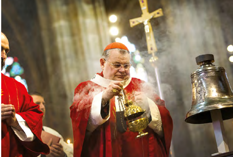
▲▼ Křest zvonu