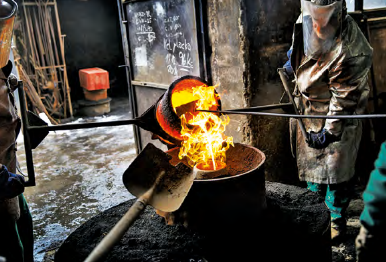
▲▼ Odlévání zvonu