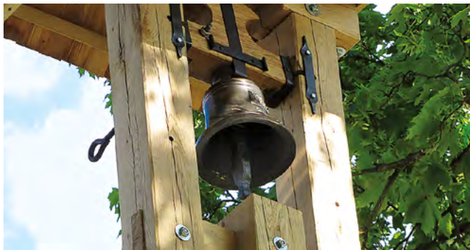
▲ Malá zvonička