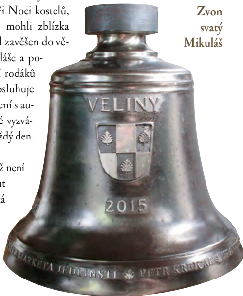
Zvon svatý Mikuláš

Po zavěšení zvonu již není možné si jej prohlédnout zblízka, proto zvonařská dílna z Brodce u Přerova vyrobila pro obec také půvabné zmenšené repliky, které lze na obecním úřadě zakoupit.